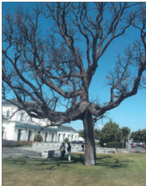
Le chêne-liège, une photo pour la postérité

Afin d'éviter toute chute de l'arbre sur cette place particulièrement fréquentée en période estivale, il a été abattu par un élagueur professionnel. Mais deux jeunes chênes liège plantés depuis 1991 assurent la relève, la place de la gare restera ombragée.