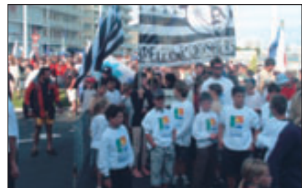
La parade d'ouverture