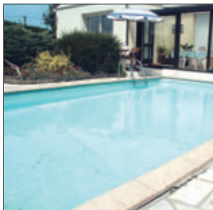
Le remplissage des piscines privées est interdit par arrêté préfectoral

La Municipalité participe activement à cette démarche citoyenne et a dû prendre des mesures de réduction des consommations en appliquant des seuils minimum permettant la conservation de la végétation et en supprimant les douches sur la plage.