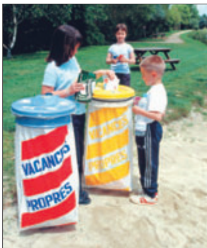
Le réflexe du tri doit partir en vacances avec vous !

L a Communauté de Communes des Olonnes rassemble les forces des 3 Communes d'Olonne sur Mer, Le Château d'Olonne et des Sables d'Olonne pour la réalisation de différentes missions parmi lesquelles la gestion du cadre de vie avec le logement et l'aménagement paysager. L'environnement, et particulièrement la collecte et le traitement