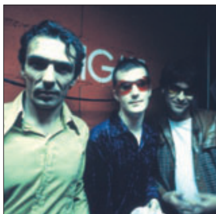
Grand Tourism : l'électro-choc !