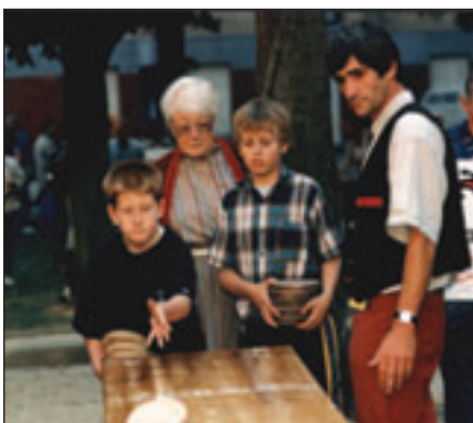
Le lundi, jouez au théâtre de verdure !

L a programmation estivale vous invite à la détente et au dépaysement tous les soirs. Ce sont plus de 60 groupes de musique, théâtre ou spectacle de rue, qui se produiront tout au long de la saison sur le remblai, à raison de 5 par soir. Les rendez-vous hebdomadaires continuent et le 11 ème festival de la Déferlante offre une programmation variée pour toutes les envies !