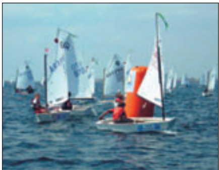
Passage de bouée très disputé.