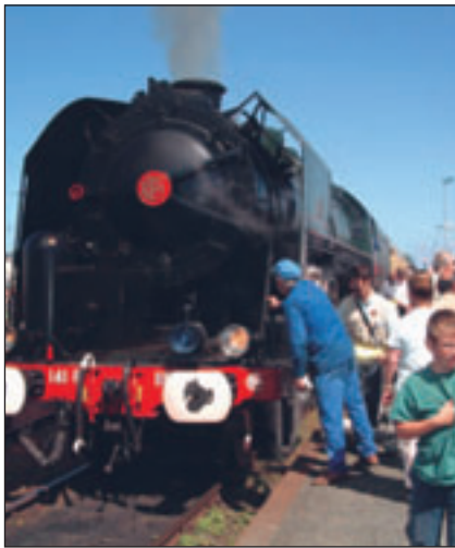
L'impressionnante locomotive a ouvert les réjouissances 2004