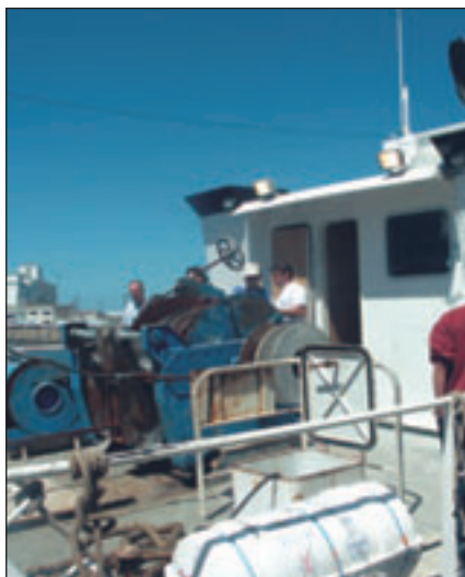
C'était l'occasion de monter à bord !

Tout le monde était au rendez-vous sur le port, depuis la criée jusqu'à la poissonnerie pilote pour profiter des nombreuses activités proposées. La dégustation de poissons, crustacés, découverte de différentes espèces a séduit les gourmets, l'occasion de parler qualité de producteurs à consommateurs. Les bateaux amarrés le long de la criée ont attiré de nombreux visiteurs : le chalutier Le Nouch, le Kifanlo, des vedettes des Affaires maritimes et de la Gendarmerie maritime.