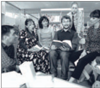
Le mardi, on vous raconte des histoires !

de la Déferlante qui vous offre une programmation de choix ! Les quais de la Chaume s'animent à nouveau avec la Guinguette mobile et des artistes de rue.