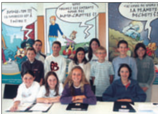
Les jeunes élus, fiers de leur campagne.

Mais déjà la fin du mandat approchait pour le CMJ avec la fin de l'année scolaire. Pour clôturer cette année particulièrement active, un voyage à Paris à l'Assemblée Nationale était organisé pour tous les jeunes élus. Ils ont ainsi eu l'opportunité de découvrir l'importance de ce lieu, toujours dans un souci d'éveil civique. La journée était bien remplie : visite de l'Assemblée Nationale à l'invitation du Député Maire Louis Guédon, promenade en bateau, visite de la tour Eiffel... Une façon de remercier ces jeunes citoyens pour leur implication dans la vie de leur cité.