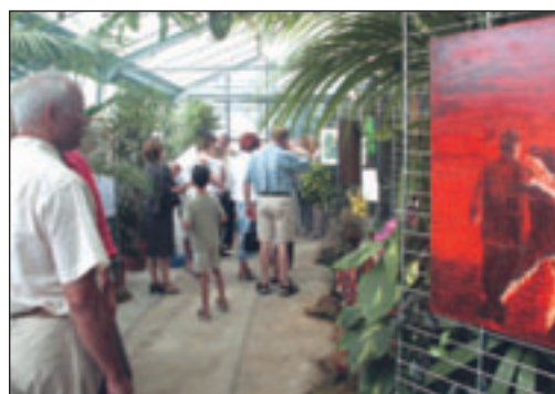
Avant goût du voyage au travers de l'exposition "Parfums du monde en suivant le Vendée Globe"

Globe, suivent les concurrents de la course des courses en faisant un voyage olfactif au fil des parfums de terres longées par les navigateurs.