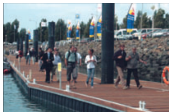
Les concurrents du Vendée Globe, ravis des nouveaux pontons

Telle la femme du marin au retour de celui-ci, Port Olona se pare de ses plus beaux atours. Les pontons sont allongés et étendus pour que cet événement puisse être partagé par tous. Et dans ce port en fête, nos marins ne seront pas les derniers à se réjouir, à partager leur sens de la convivialité qu'ils savent faire apprécier du grand public à l'exemple de l'excellente initiative "Port Ouvert" du 12 juin dernier. Jusqu'au 7 novembre 2004, date du départ du