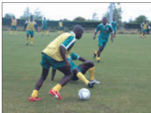
Engagement maximal sur les pelouses sablaises.