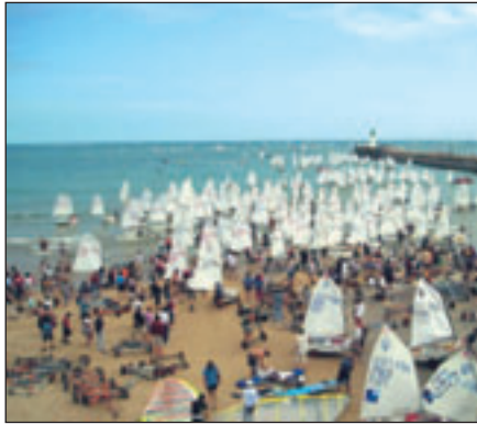
Ça en fait du monde !

Le spectacle était au rendez-vous dans cette compétition riche en sensations fortes pour les petits skippers (et leurs parents !). Le dimanche 4 juillet, un défilé au départ des