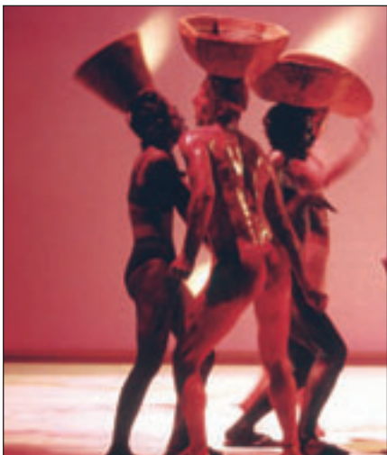
La Compagnie Galindo, le 22 juillet sur la place du Tribunal

Des rendez-vous hebdomadaires vous sont proposés, ainsi que le 11 ème festival