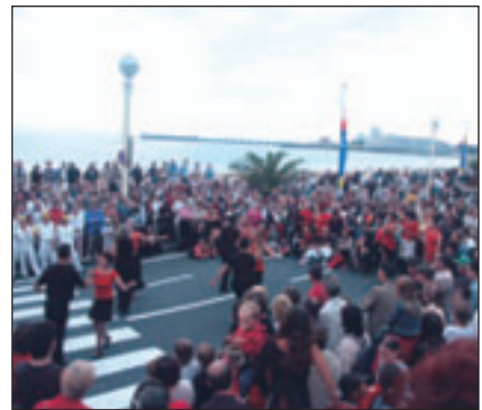
Hé! Vie danse a régalé le remblai de ses chorégraphies