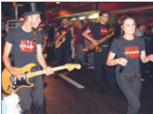
Rien n'arrête Cheese ! Pas même la pluie !

Malgré les intempéries, le groupe Cheese et la « Mad Mix », spectacle disco funk, a animé le remblai, entre deux averses. La formation déambulatoire, formée de 11