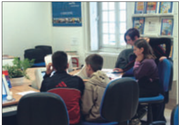
Le Centre de loisirs propose notamment des sessions à l'Espace Multimédia

En outre, des tests préalables sont requis pour les activités nautiques, ils doivent impérativement avoir été effectués dans le cadre du Centre de Loisirs des Sables d'Olonne.