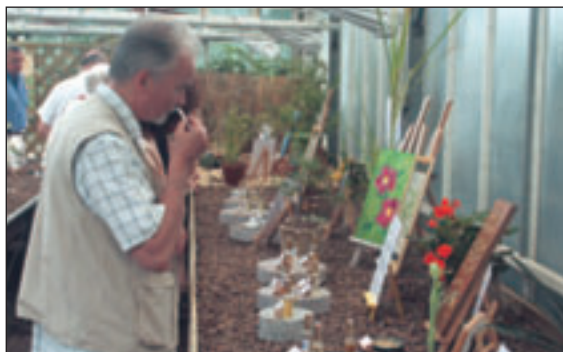
L'exposition met le sens olfactif en valeur.

Entrée de la roseraie et du labyrinthe de cannas : entrée gratuite, ouvert de 15 h 30 à 18 h pendant le mois d'août.