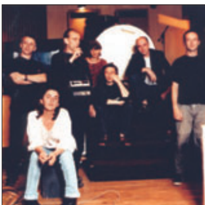
Les Têtes Raides