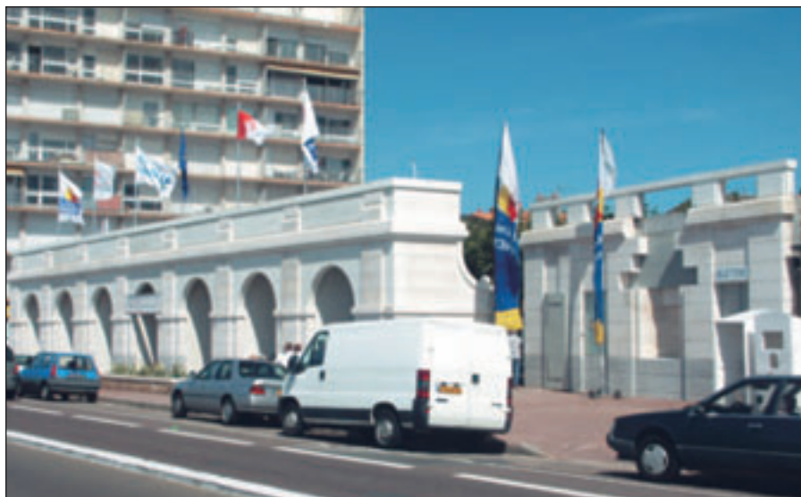
La façade s'accorde avec le style architectural du Tribunal, qui va être rénové.

L e jardin du Tribunal présente cet été une nouvelle façade, plus conforme à l'esprit de celle qui fut détruite pendant les années 1960, et en harmonie avec celle du Palais de Justice.