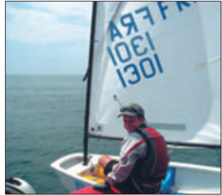
La compétition avec le sourire

L'autre moment fort attendu était le Grand raid du mercredi qui réunissait tous les concurrents sur une seule ligne de départ. Hélas, le temps en avait décidé autrement ! Vendredi, le soleil était de retour et les concurrents pouvaient reprendre la mer pour une dernière journée âprement dis-