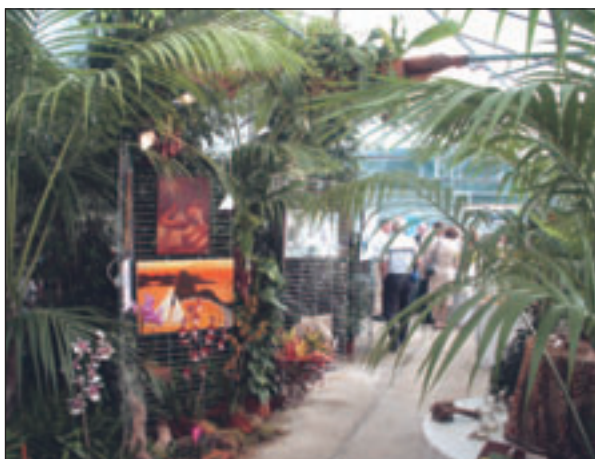
Dépaysement assuré dans ce cadre verdoyant

L' exposition Parfum du monde a lieu du 5 au 28 Juillet 2004 aux serres municipales de la ville des Sables d'Olonne, à la Mérinère sur Olonne sur Mer. Il s'agit du troisième volet de la trilogie débutée en 2002. L'édition 2004 vous invite au voyage, à la découverte des parfums en suivant le Vendée Globe.