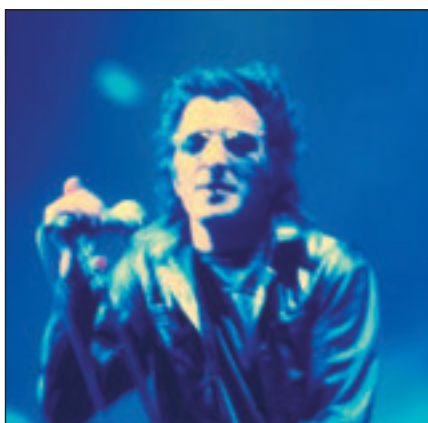
Rachid Taha, un rock coloré !