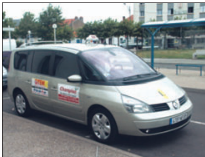
Le chèque taxi, un passeport pour la mobilité.

Peuvent bénéficier de cette aide les personnes à mobilité réduite dont les ressources mensuelles nettes fiscales ne dépassent pas 600,00 Euros pour une personne seule et 1050,00 pour un couple. Les chèques sont disponibles à la C.C.A.S à la mairie des Sables d'Olonne (1 er étage ; porte 105, Fatima Si Merabet). Deux documents sont nécessaires : le dernier avis d'imposition sur le revenu ainsi qu'une pièce d'identité.