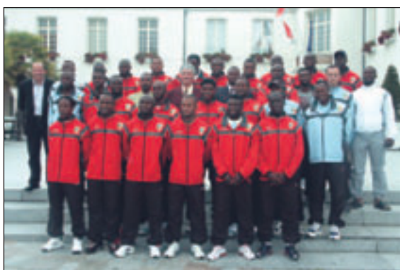
L'ensemble du groupe avec le Ministre des Sports.

L'équipe nationale de football du Congo Brazzaville a choisi la ville des Sables d'Olonne pour effectuer son stage de préparation aux matchs de qualification pour la Coupe du Monde 2006. Ce sont les locaux de l'Institut Sport Océan qui ont accueilli l'équipe nationale jusqu'à son départ le 5 Juin pour Dakar, où elle affrontait la sélection nationale du Sénégal.