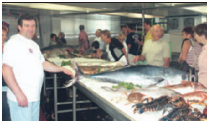
Le banc de poissons a fait bien des envieux.

Les visiteurs ont pu découvrir la réalité du métier de marin pêcheur, qui allie désormais passion de la mer et maîtrise des nouvelles technologies. Le médecin des gens de mer était présent, pour présenter les risques spécifiques aux professionnels de la mer. Grand succès également pour la simulation de vente à la criée, et la familiarisation avec les nombreuses familles de poissons présentées.