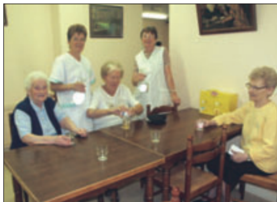
Première consigne à appliquer : bien s'hydrater !

Les personnes fragiles isolées qui désirent profiter de ces sites rafraîchis peuvent être accompagnées par les agents sociaux du service d'aide ménagère à l'aide des véhicules municipaux. Si les températures caniculaires venaient à persister, justifiant alors le passage au niveau 3, d'autres sites rafraîchis pourraient être sollicités.