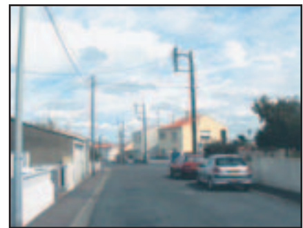
... tout comme celle de l'Abbé Marceau

La fin des travaux interviendra fin février 2005. Ce programme représente un coût de 222.000 euros, soit 120 000 euros pour l'effacement des réseaux et l'éclairage et environ 102 000 euros pour la voirie.