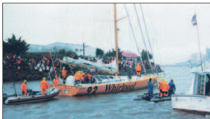
Retrouvez l'émotion du départ le 7 novembre prochain !

Parmi la vingtaine de skippers engagés dans l'« Everest des mers », 14 participeront pour la première fois au Vendée Globe. Une nouvelle génération prête à plonger dans le grand bain et prendre le départ d'un itinéraire inchangé de 43.000 kilomètres. Parcourir un tour du monde en solitaire, sans escale et sans assistance... Franchir 3 caps mythiques