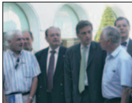
Les élus du littoral ont sensibilisé le secrétaire d'Etat aux spécificités de la Vendée.

Cette rencontre a permis de sensibiliser Frédéric de Saint-Sernin à l'enjeu majeur que constitue la gestion intégrée pour notre littoral, mais également aux problèmes d'aménagement locaux tels que la desserte ferroviaire des Sables d'Olonne et la saturation des ports de plaisance. Le secrétaire d'Etat a assuré qu'une partie des propositions de l'AVEL serait étudiée lors du prochain Comité Interministériel.