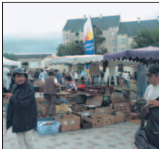
Les Bouts de ville ont rassemblé objets d'hier et métiers d'aujourd'hui

Que tous les organisateurs qui ont donné bénévolement de leur temps pour animer notre commune en soient remerciés. Gageons qu'ils renouvelleront cet engagement l'été prochain et que nous les retrouverons dans les animations qui vont faire vivre les Sables d'Olonne d'ici là.