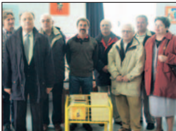
Les Sages avaient grandement contribué à l'informatisation de la bibliothèque de l'école des jardins

Le Conseil des Sages se réunit régulièrement. Lors de leur mandat de 3 ans, les 20 titulaires ont étudié les dossiers et apporté leurs points de vue avec l'expérience de leur investissement dans la vie de la cité. Les Sages qui le souhaitent ont également pu s'impliquer concrètement et certains ont participé à l'informatisation de la bibliothèque de l'école des Jardins et à l'organisation d'un concours d'illuminations pour donner un air de fête aux Sables d'Olonne à Noël.