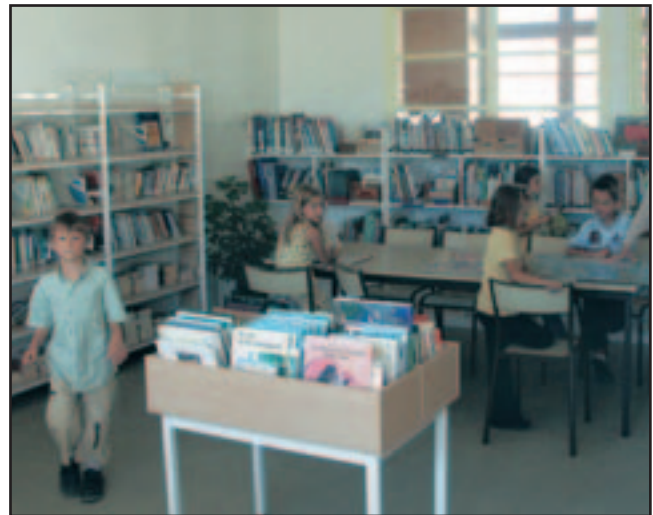
Les livres sont mis en valeur à la bibliothèque de l'Ecole Paul-Emile Pajot

en 2003 : terrassement avec des murs en bois pour retenues de sol, gazon, bac à sable central cerclé de gradins, aire de jeux en sol souple et allée menant au potager. Le jardin pédagogique connaît le succès espéré. Les jeunes jardiniers que sont les élèves assurent leur production de fruits et légumes en septembre. Deux arbres viendront compléter l'aménagement du jardin.