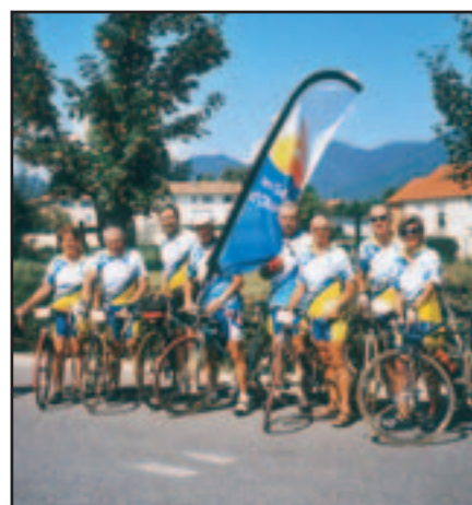
Les cyclos sablais ont tutoyé les sommets en Alsace

La douzaine de Sablais a couvert entre 750 et 1000 km chacun sur 7 jours de sorties, les parcours présentant des dénivelés de 400 à 2700 m.