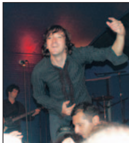
Cali, bête de scène tous-temps

L'esprit du festival, c'est encore de faire découvrir des formations moins connues mais très talentueuses, telles que L'œil dans le rétro.