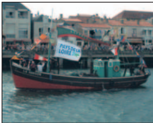
Le Kifnalo, à découvrir lors des journées du patrimoine... ou de la Grande Bordée !

C réées en 1984 par le ministère de la culture, les Journées du patrimoine ont lieu, tous les ans, le troisième week-end de septembre (samedi 18 et dimanche 19 septembre). Événement culturel de la rentrée, ces journées enregistrent chaque année plus de 11 millions de visites et témoignent de l'intérêt des Français pour l'histoire des lieux et de l'art.