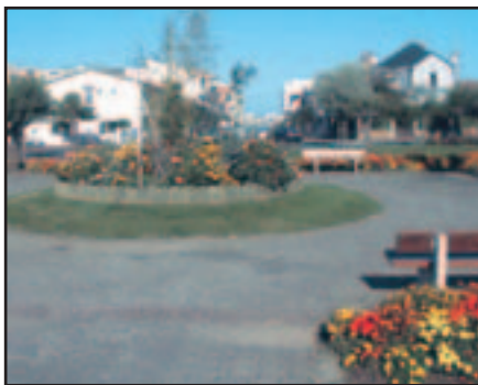
La place de Schwabach évoque l'Amérique du Sud