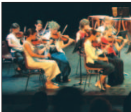
La formation des jeunes est au coeur des missions de l'EMMA

L' École Municipale de Musique Agréée (EMMA) des Sables d'Olonne, installée dans l'Abbaye Sainte-Croix, est largement connue dans la mémoire collective comme le "conservatoire de musique". Rattachée à la Communauté de Communes des Olonnes, elle forme chaque année plus de 500 musiciens, enfants et adultes, autour de trois mots-clés : plaisir, éclectisme et pédagogie.