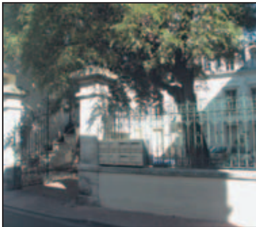
L'hôtel des Ombrées est situé en plein coeur du centre-ville.

Actuellement hébergée en Mairie des Sables d'Olonne, la Mission Locale accompagne les jeunes chercheurs d'emploi de 16 à 25 ans dans leur insertion professionnelle. Elle accueille les jeunes sortis du système scolaire, sur les 9 cantons