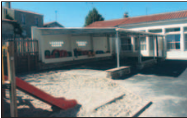
La cour de la maternelle Lieutenant Anger a été remise à neuf

sont les siennes et pour accompagner cette dynamique, la Ville des Sables d'Olonne apporte des améliorations aux écoles en suivant une programmation définie en concertation avec enseignants et parents d'élèves. En 2004, le coût des travaux s'élève à 126 767 euros sur les 146 354 euros affectés aux écoles, le solde étant consacré au mobilier et au matériel. La finalité de ces travaux est d'accompagner l'élève dans son épanouissement par un environnement de qualité.