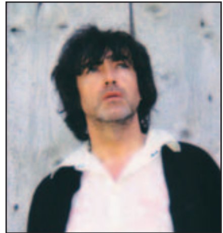
Jean-Louis Murat, chanteur inclassable