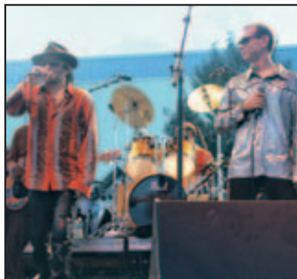
Rachid Taha et les Têtes Raides de concert.

Rachid Taha, les Têtes Raides et Grand Tourism : le public a apprécié le show des têtes d'affiche, à la suite de Treiz', le groupe vainqueur du tremplin 2004, qui a ouvert le festival. Une grande première pour ces jeunes des Olonnes, qui ne s'étaient jamais produit sur une telle scène.