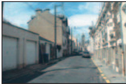
La rue du Sémaphore va perdre des poteaux et câbles...

Les travaux, entrepris la première semai-