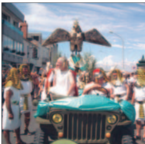
Les Chaumois ont remonté l'histoire.

C ulture, sport, animation : l'agenda estival a été riche de toutes les manifestations organisées par les associations sablaises, en collaboration avec la Ville des Sables d'Olonne. Merci aux associations, actrices incontournables de l'animation estivale locale. Rétrospective des manifestations qui ont marqué l'été 2004.