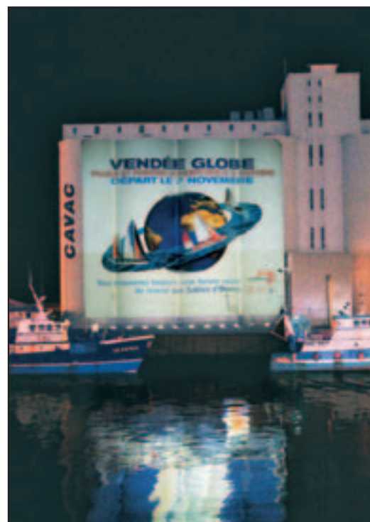
Les silos annoncent le Vendée Globe par une succession d'images monumentales

Ce point de rencontre officiel entre les rêves des skippers et ceux de leurs admirateurs mobilisera notre action et avec vous, tous ensemble, nous assurerons le succès de la 5 ème édition, aux Sables d'Olonne, du Vendée Globe.