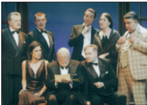
Devinez qui ? une pléiade d'acteurs renommés et autant de coupables potentiels !

Abonnements auprès de l'Office de tourisme des Atlantes tél 02 51 96 85 85.