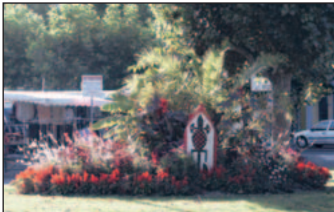
Le fleurissement du centre-ville s'inspire de l'Afrique.

Le jury rendra son avis à la fin de l'année quant à la conservation par la Ville de son label 4 fleurs. Mais d'ores et déjà, ses membres se sont montrés admiratifs de la roseraie et du labyrinthe de cannas ouverts au public pendant tout l'été aux serres municipales de la Mérinière. 3000 visiteurs ont ainsi profité de cette visite parmi les 850 cannas et les 600 rosiers.