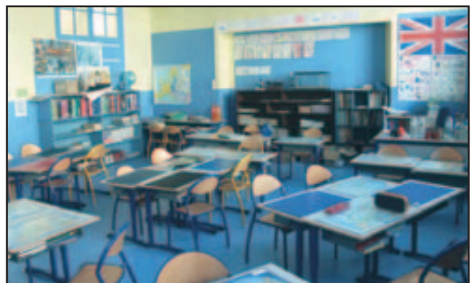
L'Ecole du Centre a bénéficié de travaux tant pour la cour de récréation que dans deux de ses classes.

moniteurs de l'Institut Sports Océan initient les élèves de CE et CM à la voile, et ceux de CM2 au kayak. Sauront-ils faire naître de belles vocations de marins ?