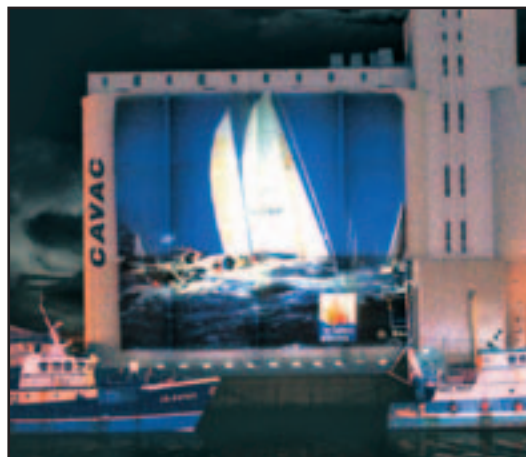
Les visuels seront renouvelés début octobre.

Ce sont ainsi plus d'une vingtaine d'images que les spectateurs peuvent voir défiler sur cet écran d'un genre particulier de plus de 400m 2 . Présente depuis début août, l'attraction a séduit les promeneurs par son originalité. Calendrier sportif oblige, la première manifestation mise à l'honneur sur les écrans géants est le Vendée Globe. Des vues du pays des Olonnes alternent avec les images de la course, offrant aux clients des bars et restaurants un