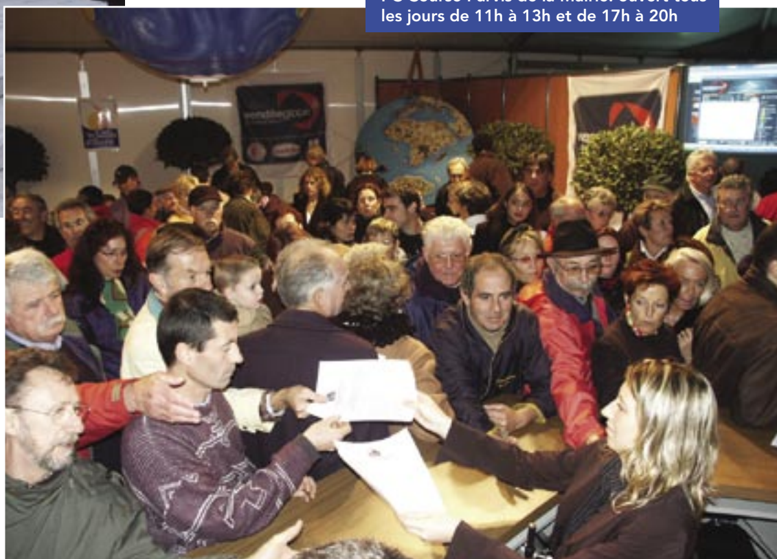
PC Course-Parvis de la Mairie. ouvert tous les jours de 11h à 13h et de 17h à 20h

Pour les habitants des Olonnes, le PC Course sur l'Esplanade de la Mairie par la Ville des Sables d'Olonne permet de tout savoir sur la course. Le grand rendez-vous quotidien est la retransmission en direct, sur écran géant, des vacances entre l'organisation et les navigateurs. Proposant de nombreuses animations, expositions, conférences et jeux, cet espace, qui se veut vivant et convivial, déli-