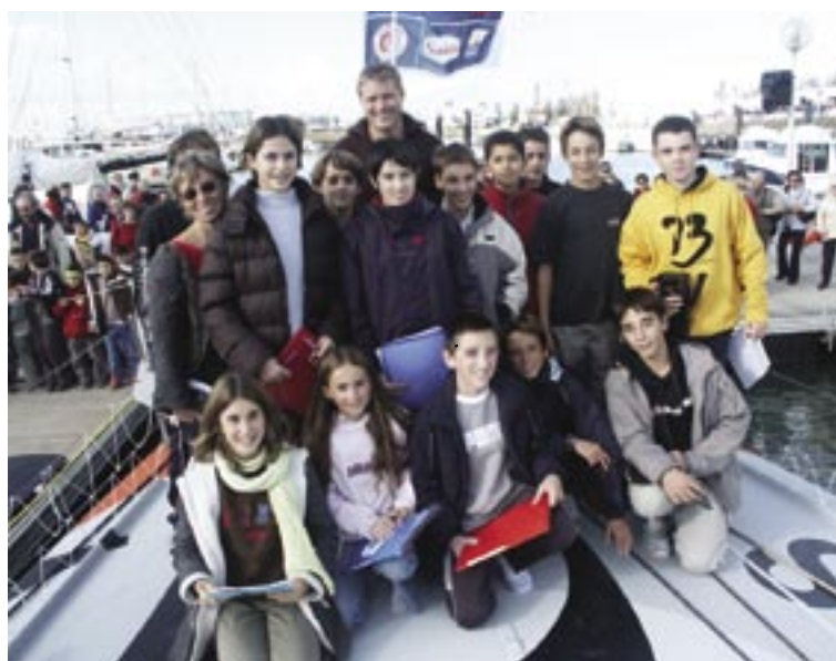
Les jeunes du collège du Centre avec Alex Thomson sur Hugo Boss.

Premier rassemblement nautique étudiant en Europe, la course croisière EDHEC réunira des milliers d'étudiants pour une semaine de voile, de sport et de détente. En 2002, la course croisière avait réuni 6000 étudiants du monde entier autour d'épreuves sportives de haut niveau, sur terre et sur mer. Dans une ambiance conviviale, 200 bateaux et leur équipage, ainsi que 85 concurrents se sont affrontés dans une ambiance conviviale.