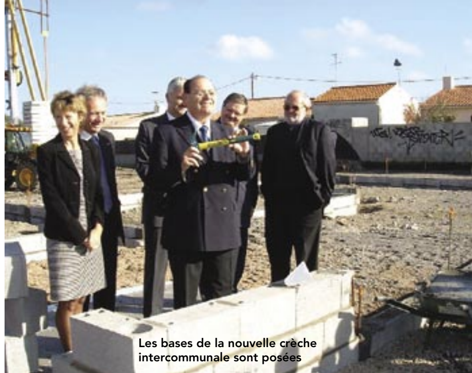
Les bases de la nouvelle crèche intercommunale sont posées

Côté développement économique, la CCO a renouvelé le 15 novembre le partenariat mis en place il y a plusieurs années avec la Chambre de métiers, lequel porte sur l'accompagnement des créateurs d'entreprises et sur la