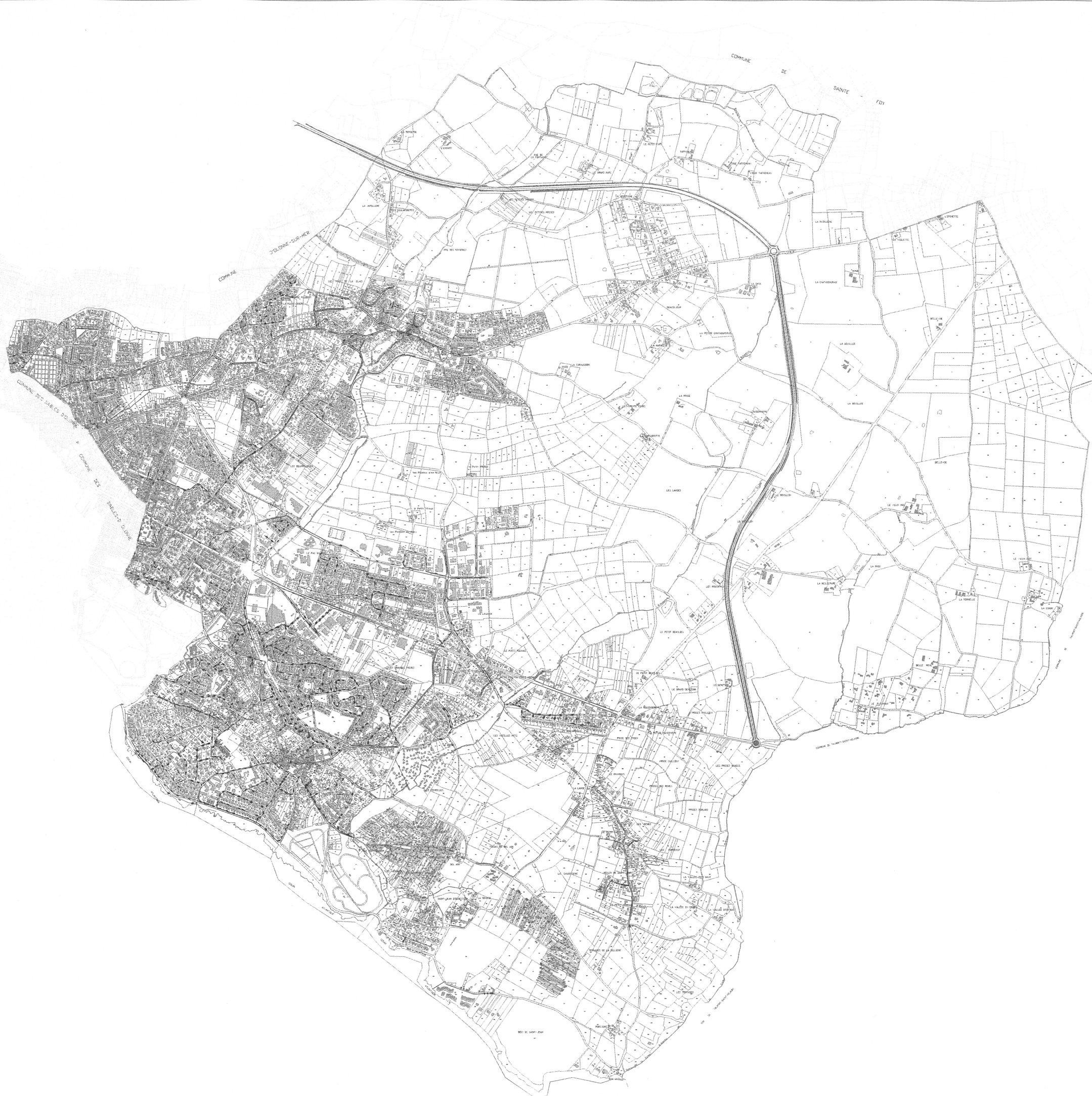
— Réseau d'assainissement