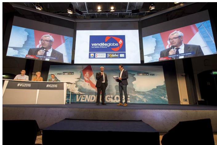
Ambiance during official launch of the Vendee Globe 2016 at Palais Brongniart in Paris, France, on september 14, 2016