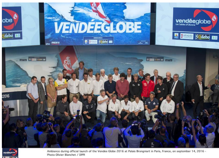
Ambiance during official launch of the Vendee Globe 2016 at Palais Brongniart in Paris, France, on september 14, 2016