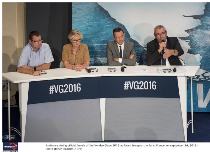
Ambiance during official launch of the Vendee Globe 2016 at Palais Brongniart in Paris, France, on september 14, 2016