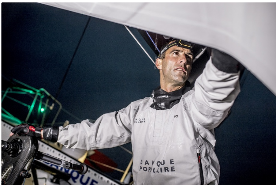
Onboard image bank for Armel Le Cléac'h (FRA), skipper Banque Populaire VIII, prior to the Vendée Globe 2016, solo circumnavigation race starting on november 6, in Lorient, south brittany, on september 19-20, 2016

Armel Le Cléac'h a stabilisé l'affaire et repris quelques milles à Alex Thomson, qui évolue 90 milles dans son axe arrière. Verdict dans une semaine. Jérémie Beyou, troisième, va passer l'équateur aujourd'hui. A l'autre bout du monde, sous la Nouvelle-Zélande, un skipper heureux : Sébastien Destremau.