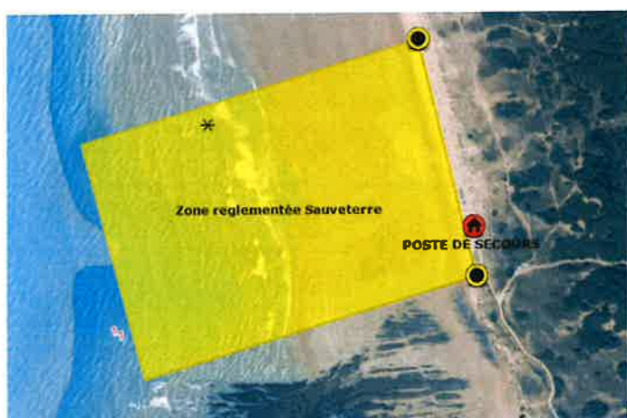
Plage des Granges