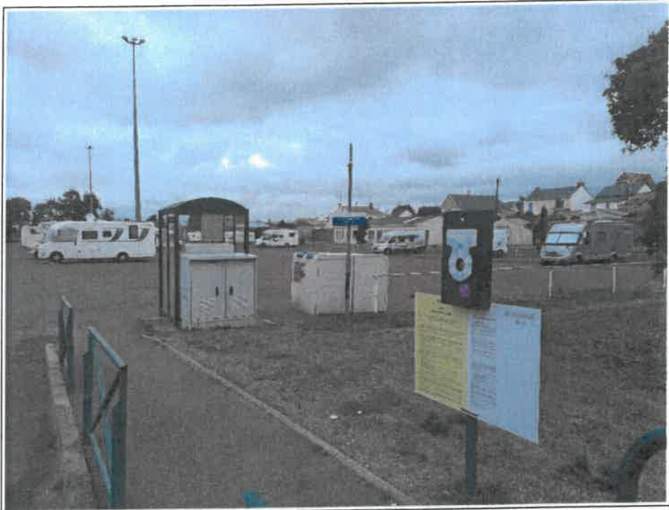
Fichier : IMG_20230825_100318.jpg Remonté le : 25/08/2023 11:23