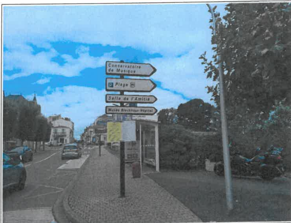
Fichier : IMG_20230825_101637.jpg Remonté le : 25/08/2023 11:23