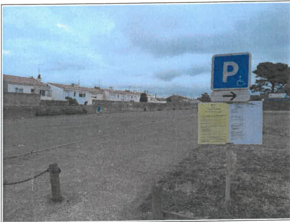
Fichier : IMG_20230825_100543.jpg Remonté le : 25/08/2023 11:23