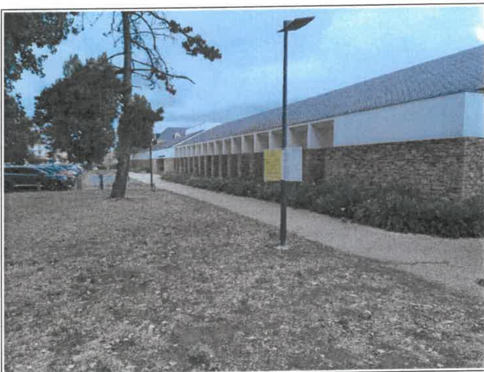
Fichier : IMG_20230825_101740.jpg Remonté le : 25/08/2023 11:23